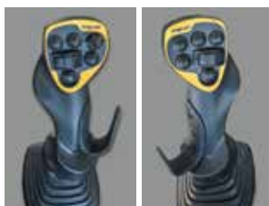
조이스틱 조향 (옵션) NEW

작업 중 차속이 0 km/h이 되면 자동으로 브레이크가 작동하고 가속페달 조작 시 자동해제