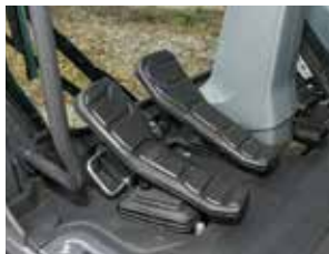
새로운 디자인의 페달

조작이 편리한 신규 디자인의 키패드 적용하여 스위치 접근성 및 조작 편의성 증대